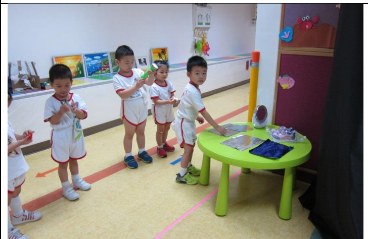
相片三：幼兒自選認為能協助完成任務的工具