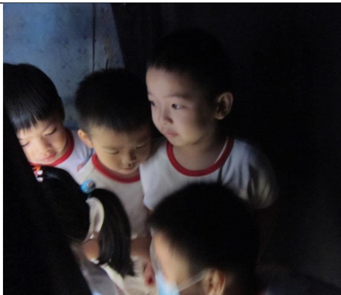
相片二：幼兒進入黑房進行探索