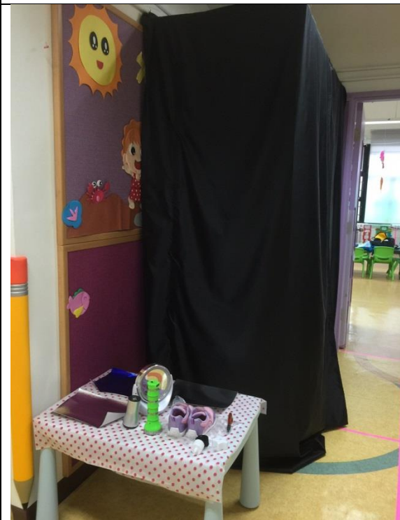
相片一：環境創設（黑房）